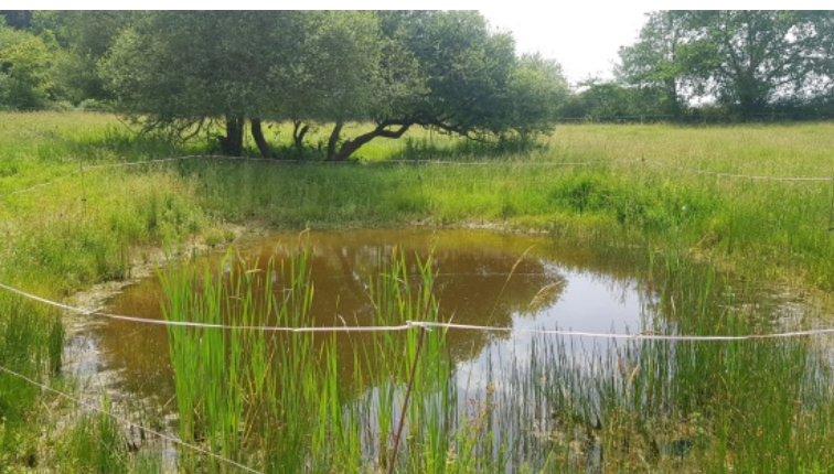
Mare réalisée par le GIEE du Layon