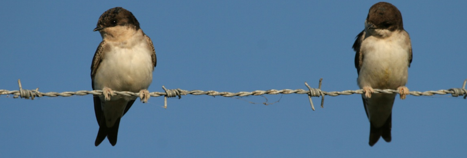
Hirondelle de fenêtre, espèce liée au bâti, désormais classée NT dans la liste rouge des Pays de la Loire