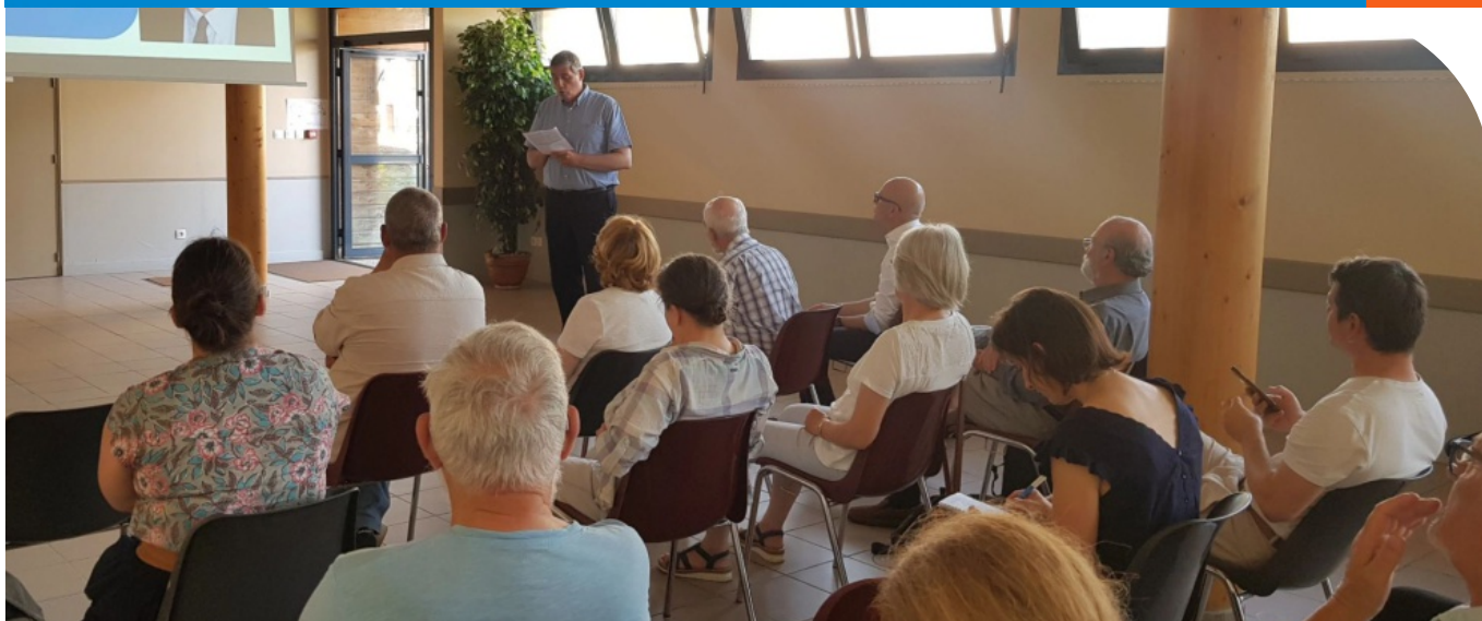
Assemblée générale 2026 de la coordination régionale LPO Pays de la Loire