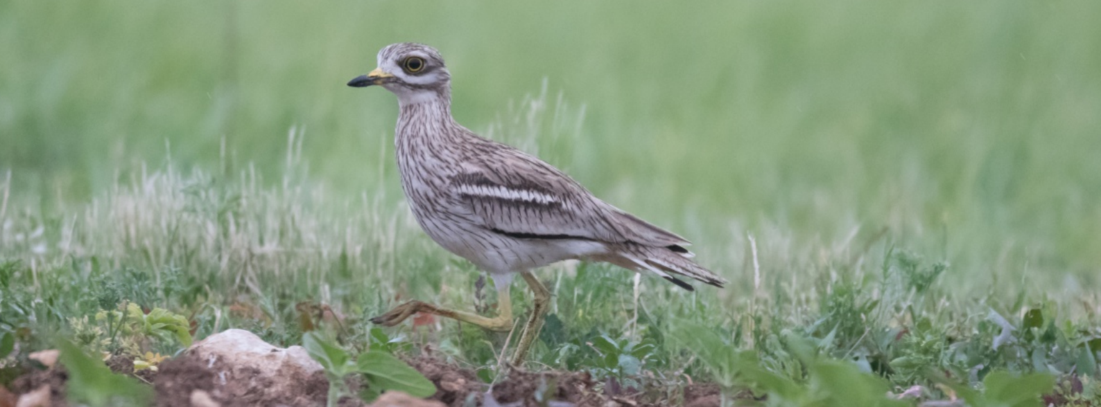
CEdicnème criard, une des espèces suivies de près en 2025