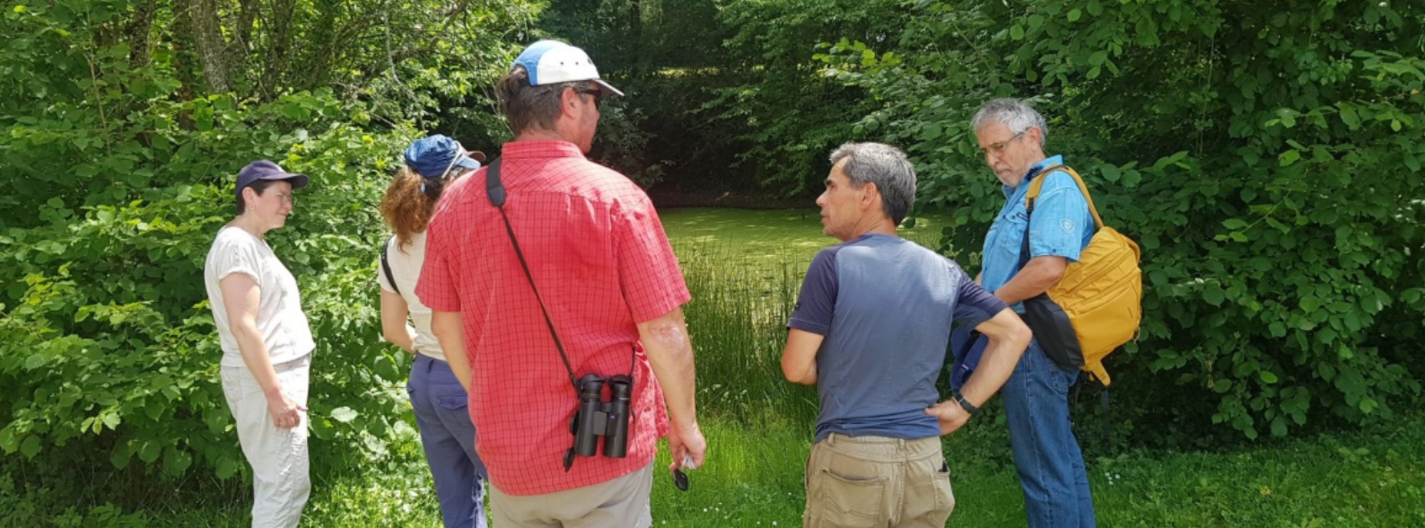
Sortie lors de l'assemblée générale 2026 - Photo © Mickaël Potard - LPO